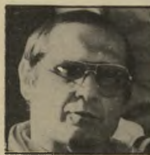
מאמן בבר אין חסינות!

לעיתים גם להחמיא - הוא ללא ספק מר-מאמן של הכדורסל הישראלי.