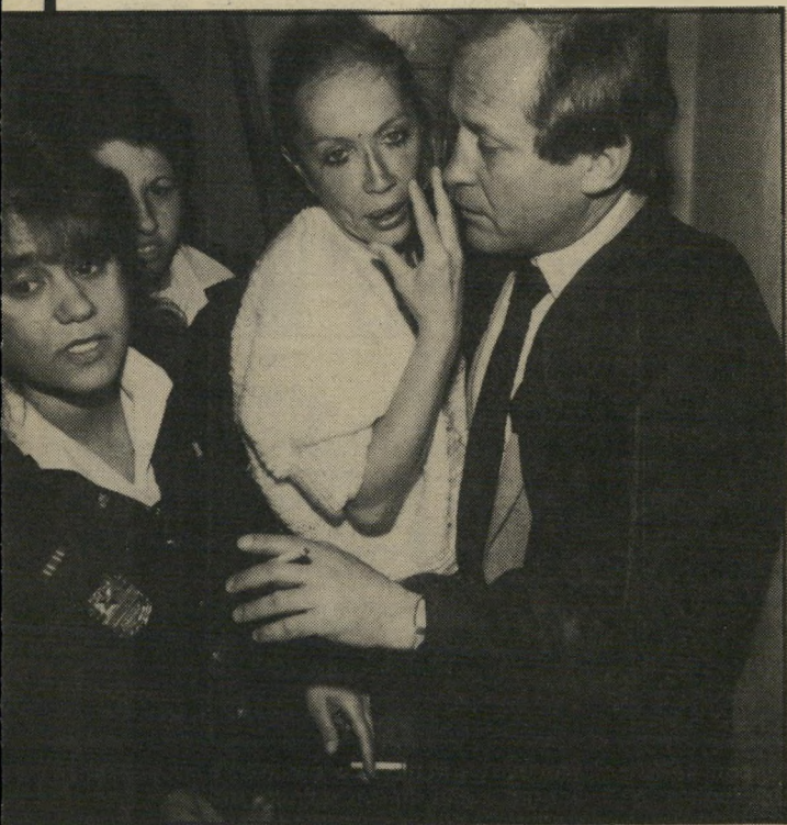
הסניגור, הנאשמת והשוטרות במיפדרון צוואה בתיק