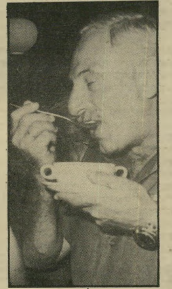
מנהל אפרת בורות בשווייץ

חלק ממערך החירום של ישראל הם מאגריהרלק, ובכלל זה מאגרי הגאז. האחריות על הקמתם ואחזקתם של המאגרים הוטלה על החברה הממשל-תית 'שרותי נפט', שמנהלה הוא ה-