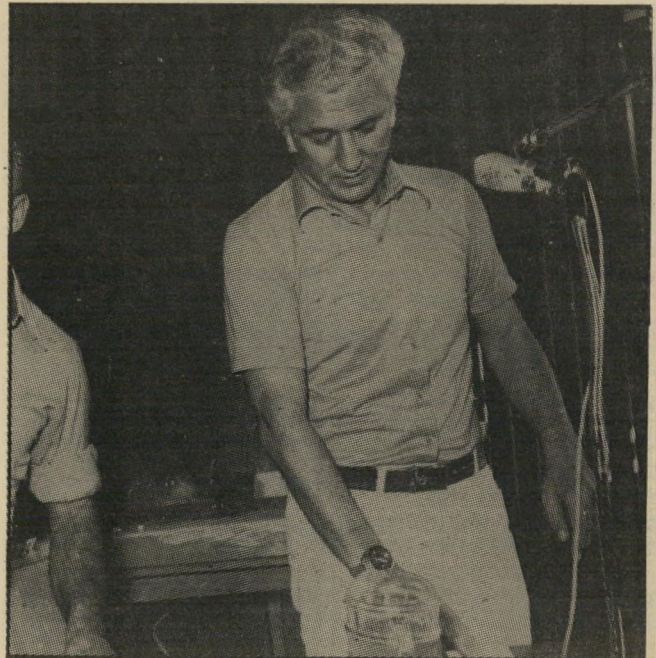
לא-מזכ"ל שפיזר היכן היה הגיבוי?

לרפאל רקנאטי, ידיד אחר של פרס, שאף הוא, כמו שווימר, התרים כספים עבור הגופים הפוליטיים בהם היה פרס שותף, קשה מאוד לשכוח את התחייבותו של פרס שלא יקרה לו מאומה בעיקבות נפילת-המניות ומסקנות ועי-דניסקי.