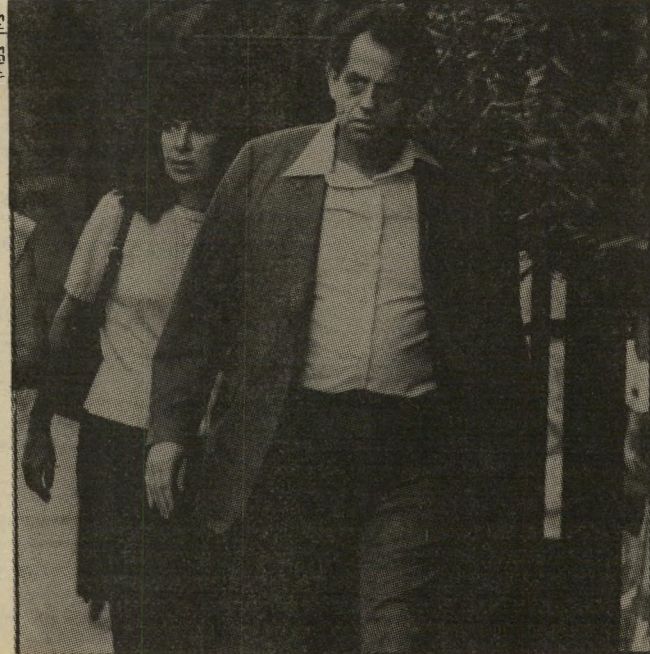
לא-יועץ צ'חנובר איד הוצעק מאמריקה?