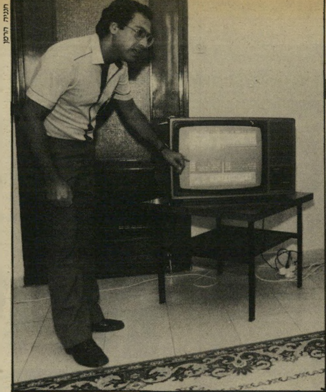
מועמד פלג ברגע האחרון

לפני ארבעה שנים הצטרף להתאחדות. ב-1984 הקים, ביחד עם עוד שני שה עסקנים, חטיבה קטנה בתוך ההתי-אחדות, הם מכניז עצמם חטיבה על-