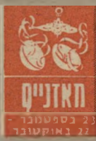
האזניים 23 בספטמבר - 22 באוקטובר