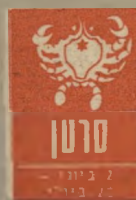
סרטן 7 ביולי - 23 ביולי