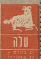
טלה 21 במרס - 20 באפריל