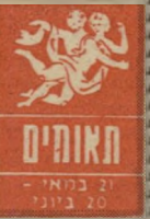
תאומים 21 במאי - 20 ביולי