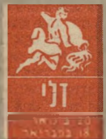
דלי 20 בספטמבר - 18 באוקטובר