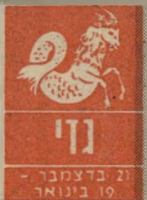
נדוי 21 בדצמבר - 10 בינואר

בתחום הכספי אתם עומדים לקבל בשורות משמחות, עניינים שונים שלא היו ברורים עד עתה יתבררו, ועכשיו תוכלו לשלוט במצב ול"תמרן לפי מיטב הבנת"כם. הכספים שיגיעו א"ליכם אינם דווקא מע"בודה שיגרתית, זה יכול להיות קשור לכספי מישפחה, הגרלות או עסקות מוצלחות, חברי"אות שלכם או של הסו"בבים אתכם אינה ה"בה, ויהיה עליכם לטפל בעצמכם. כדאי יהיה לחשוב כעת על התייעצות עם רופא נוסף.