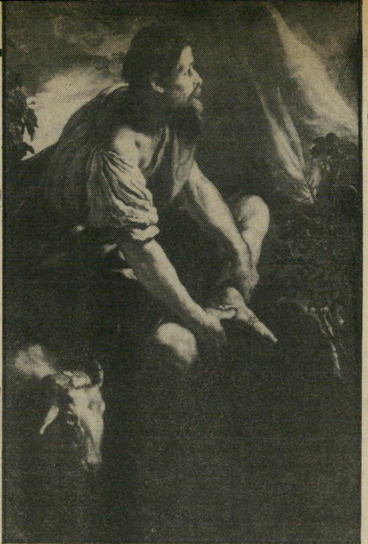
משה ליד הסנה (דומניקו פטי, 1614) מנהיג של רועים בדווים