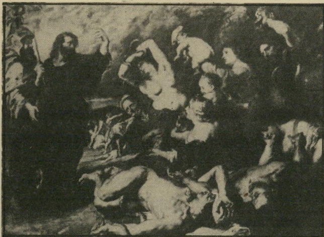
משה, המטה והנחש (רובנס, 1635) להטוטן המפעיל את קסמו

שזה הרכוז הגדול ביותר של ציורים שנמצא באיזשהו אתר אייפעם. אחרים מהציורים ממש מדהימים. למשל: סלע ועליו ציור של עשר מיש בצות, הדומות בצורתן ללוח של עש רת-הדיברות, ציור של מטה ונחש, כמו המטה שמשו הפך לנחש.