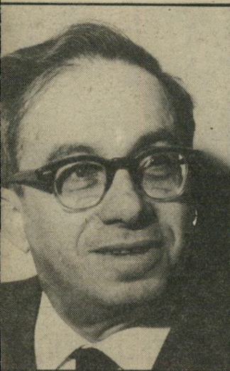
סרן (1965) צימוקים ושקדים

נפטור בגיל 92 , רב סרן נוח (סכא נוח) וולפובסקי , מי