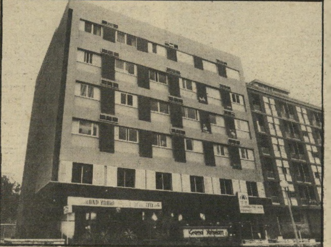
המלון של מנוחין בנתניה חתימה מזוייפת על ערבות

שר-לשעבר בהיאורגד הסוחר אמר שיש לו שרי-אוצר בכיס להוציא למען שמאי את הערמונים מן האש. לעומת כמעט כל יתר היוזפים, ש"מיסמכי-הקרקעות שרכשו הוכרוזו כמי זוייפים בעיקבות ההודאה של עודה, יש בידי שמאי 1070 דונם כשרים. הפרקליטות הצבאית טוענת כי תורו של שמאי יגיע במיסגרת תביעות של הפרקליטות האזרחית. זו ממתנה להשלמת עבודתה של המישטרה.