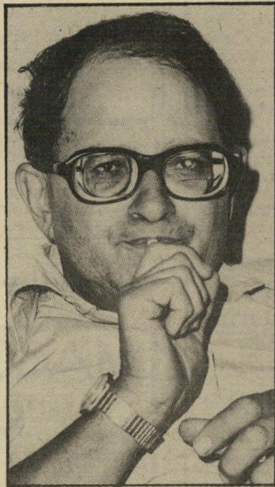
רבי איתן: המכעילים ברחו

שליטה זו עלולה לגרום בארץ לשאננות, להרגשה שהכל מותר והכל אפשרי. והיא אשליה