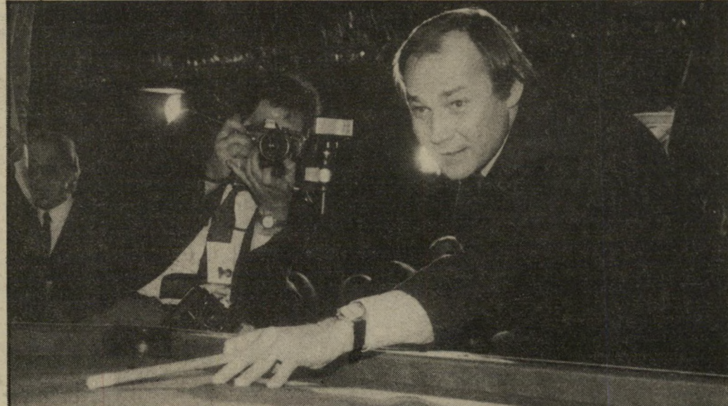
קלאוס מריה בראנדאוור מושק ביליארד במסיבת הפתיחה של הפסטיבל פול ניומן לא בא - בראנדאוור בא

תיים, ותיקוה אדירה ששלום ממשי יביא בעקבותיו גם שלום רישמי? הוודקה, שהובאה במיוחד ממוסק"ו, ניגרה על ראשי חברי צוות ה"שופטים, ובמיוחד על נשיאם, השחקן קלאוס מריה בראנדאוור, שהיה האי"שיות הדומיננטית ביותר מן המערב. בינתיים ראו 1700 עיתונאים, פלוס אנשי מיקצוע, סטודנטים וסתם קהל