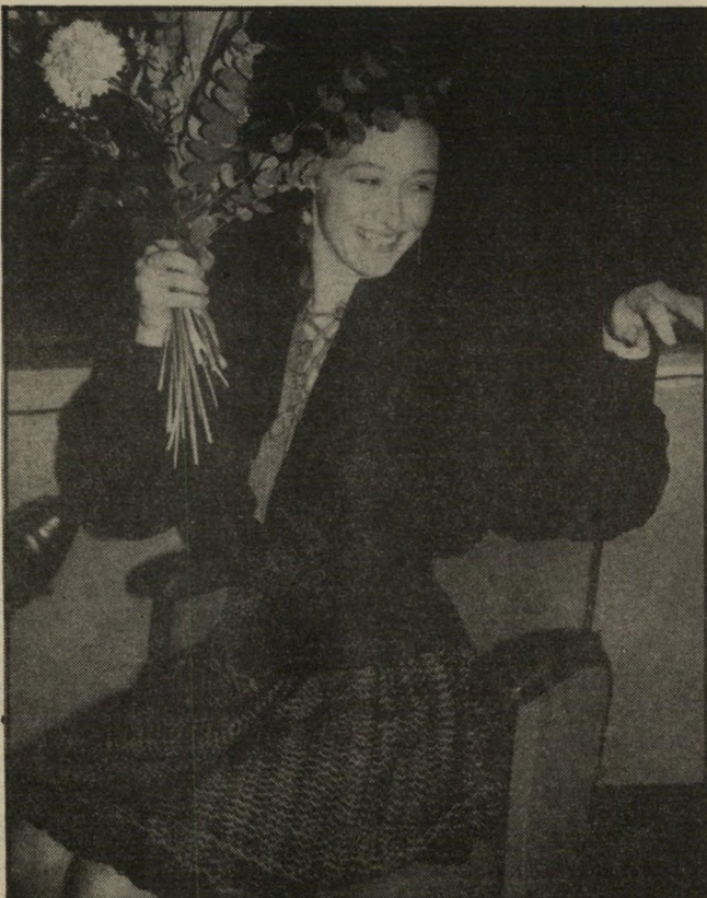
שחקנית ז'אן מורו בבכורת סרטו של קלוד שאברול, "מסכות" צהלת הפסטיבל הראשון

תיים, ותיקוה אדירה ששלום ממשי יביא בעקבותיו גם שלום רישמי? הוודקה, שהובאה במיוחד ממוסק"ו, ניגרה על ראשי חברי צוות ה"שופטים, ובמיוחד על נשיאם, השחקן קלאוס מריה בראנדאוור, שהיה האי"שיות הדומיננטית ביותר מן המערב. בינתיים ראו 1700 עיתונאים, פלוס אנשי מיקצוע, סטודנטים וסתם קהל