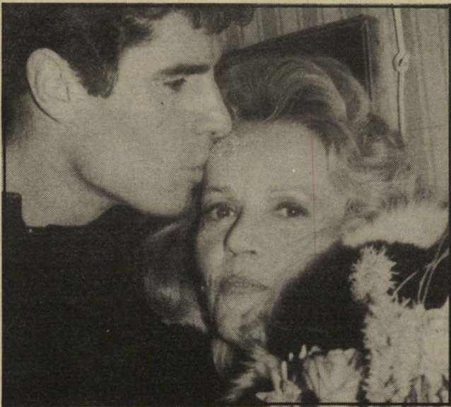
שחקנית ז'אן מורו בהצגת הסרט "הנס" של ז'אן פייר מוקי בן לוויה רומנטי

מיותר להסביר מדוע נאסר הסרט להצגה בשעתו (ראה במסגרת: ראיון עם הכימאי). גם היום ישנם רבים ביניהם יבגני יבטושנקו, המעדיפים