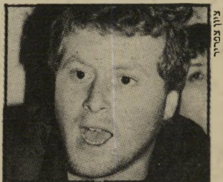
אח חיחינאשווילי מסיבת גיוס

שיבכה חודשי העריקות האחרונים היו קשים לרפאל. כמו חתול ועכבר שיחקו רפאל והצבא במחבואים. רפאל