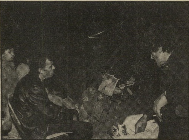
שמונה הנפשות מתחת ליריעות דולפות היה רשום בטאבו

לגופו של עניין, טען הדובר כי הדיין נהג כראוי, והוסיף: "המילה מט' עמים' במילון אבן-שושן פירושה: אוכל שטעמו טוב, ובהשאלה: העיתון הגיש מטעמים סיפורתיים".