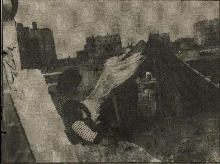
מישפחת רבאה על הריסות ביתה התינוק לקח בדלקת ריאות