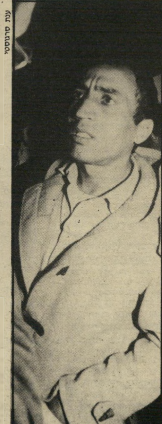
ח"כ ביטון כרטיס למוסקוה!

הם רבים וצועקים רק כשהטלוויזיה, הרדיו והעיתונות מקשיבה. בדרך כלל הם חברים טובים, מסיעים זה את זה לבית-המלון. מציעים טרמפ לתל-אביב.