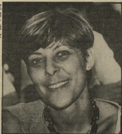
מזכירת-סיעה מלר שומרים סוד

חבריה הכנסת דויד ליבאי, (מע"ר), נכנס למיונן. הוא מלווה בר"עיתו, ניצה שפירא-ליבאי. השנ"יים עוברים את המיונן, מחפשים בע"יניהם שולחן פנוי. בקצה המיונן, בפינה ליד הקיר, הם מוצאים שולחן מרובע. יושבים. מלצר וריז מתקרב. הזוג מומין ארוחת-צהריים קלה. דג ממולא 1.80 ש"ח, סלט חצילים 1.50 ש"ח וקפה 1 ש"ח. בשולחנות הסמוכים משתדר שקט. חזרו זה אל זה? לא חזרו? הם מנהלים את הגירושין למופת. הם