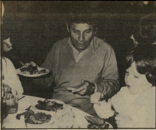
עיתונאי רייכר לידו לא מעשנים

אל המיונן פוסע בצעדים גדולים השר אריאל שרון (ליכוד). הוא קוער ראשון. מאחוריו יועציו ועוזריו. עמורם פליישר, רוכב המישרה, ישראל בן, עוזר, עוזר שמרי,