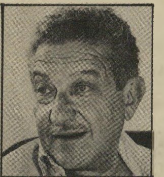
שר וייצמן סחתיין!

חבר הכנסת אהוד אולמרט (ליכוד), בחליפה אפורה, נוטש שלושה עיתונאים ועוזב את השולחן. כשהוא מושיט יד לשלום. השר מנשה שחל (מערך), בחליפה מחוייטת למהדרין (שלושה חלקים שחל"ה הוא השר ההודו ביותר בממ"שלה) לוחץ את ידו של אולמרט.