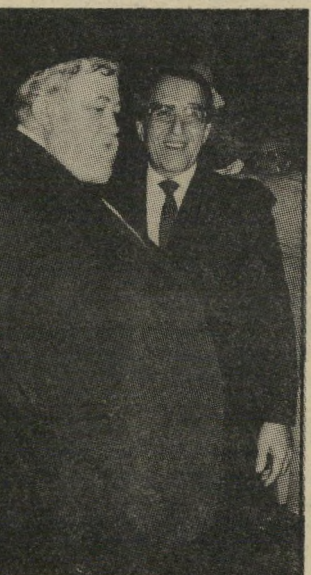
ח"כ שפירא ושר שחל חליפה מחוייטת למהדרין

השעה 1 בצהריים. מיזנון חברי הכנסת מתחיל להתמלא באנשים. חברי הכנסת גמרו את עבודת הבוקר.