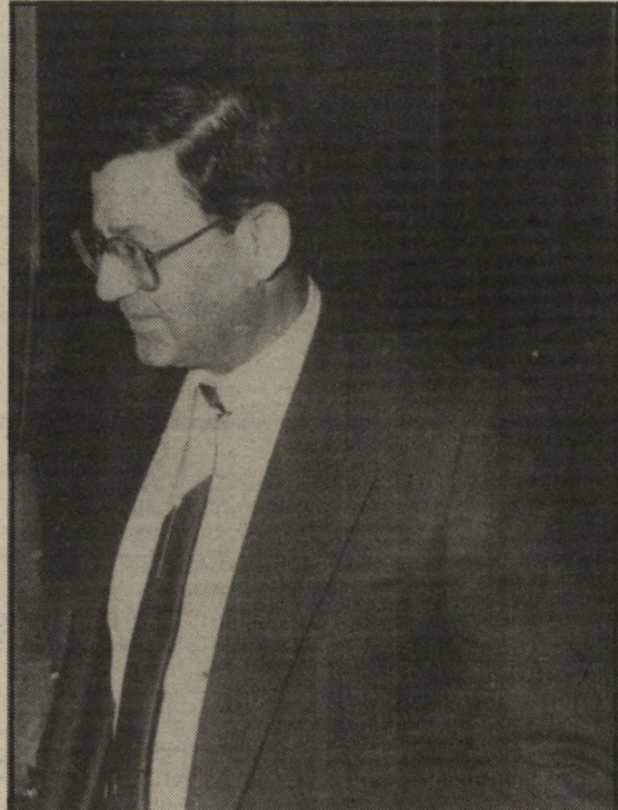
פרופ' יורם נורמן