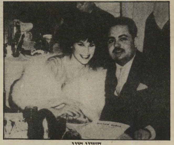
חשוגי חוגג מי שלט בחשבון השווייצים

15.586% הפקד חשוגי 15 מיליון דולר בחשבון השווייצים המיסטורי של חברת בשם לייק רי-אורסרס (משאבי הגאס), אחרי ש-קיבל 18 מיליון דולר בהתמאות דחר יות. לא ברור מה קרה להפרש של 3 מיליון דולר. חשוגי טען שזו ריבית. גורבאניפאר טען כי החשבון נופח, וכי הכסף הלך לקונטראס. יש ברוח רמזים לעסקות נוספות באותה תקופה. באוגוסט 1986 הוסכם על מישלוח של 1000 טילי טאו. שתי מערכות-ראדאר לטיילי הוק נשק ישראלי נוספי. לאחר מכן ביקש גורבאניפאר לוותר על הנשק הישראלי, ולקבל עוד 1000 טילי טאו. סמוך לאותה תקופה הביעו ראשי הטייפאי דאגה לגבי