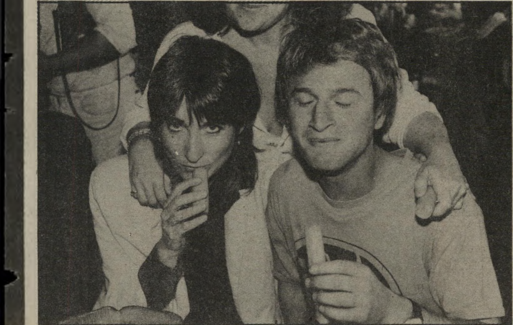
דוב נבון השחקן שהופיע לאחרונה בהצגות קדיש והחילוני האחרון של ה־תיאטרון הקאמרי, אחז גם הוא בגזר. לצדו: הסופרת גלילה רון־פדר, מחברת הסידרה גינג'י שהיתה תשושה לחלוטין מהמאמץ שבאכילת הירק הכתום. על כתמו עוד גזר - בתוך כריידיה של ציפי שביט.