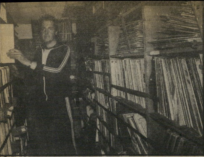
מגיש דרבי בתקליטה "להפסיק את הרעש"

שים, גברים, בטלנים וחרוצים. מחפשי דרך כרוניים ונוודים נצחיים מכל העור לם חנו בה לרגע, טעמו את הים והחול ונדרו הלאה.