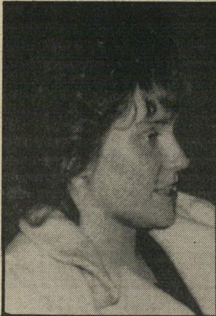
ג'ידנתן ואן פולארד מדוע הם היו דרושים?

הם רוצים להשתמש ברעיון של הוועידה כדי ליצור מראית-עין של פעי-