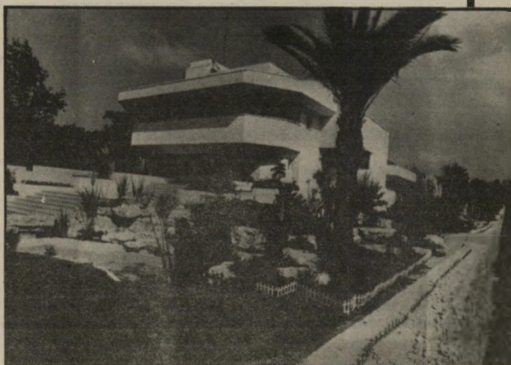
בית יגאל גינדי לא תרמו כסף לליכוד