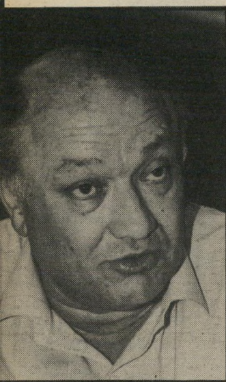
קפטן בן-טובים 13 קלפים ביד

מלכה, גיבור ועידת-החרות שנערכה באותו האולם, ליום-המישחקים הא-חרון. "הכנו לו אפילו שולחן."