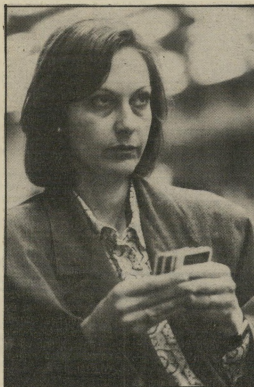
שחקנית חכמי גם ראש עיריית באר-שבע

באנגליה, למשל, יוצאת נבחרת מעורבת של בית-הלורדים ובית-הנבחרים מאז 1984 לאמריקה, לשחק מול נבחרת-הקונגרס. שחקני הכרידג' יודעים לספר כי באמריקה רצחה אשה את בעלה מפני שלא הכריז נכון ליד השולחן. הם מספרים שהיא קיבלה חנינה, כי השופט היה שחקן-כרידג'.