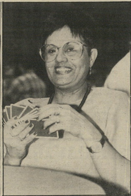
שחקנית שמפי הכל בהתנדבות

ספנוש, בפעם הראשונה בארץ, כי קש שלא לדבר על פוליטיקה, והיה מוכן רק לספר כי הוא עובד ממשלה,