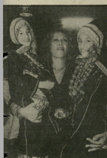
זמרת צענני כל בוקר

רשת־אלף של קול־ישראל, שנחשבה עד לתקופה האחרונה כרשת נידחת ולא מעניינת, ושאה וזתה בשם־החיבה "סיביר", מרענת את מיווך