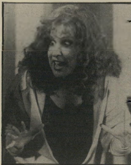
שחקנית מידלר 60 מיליון דולר

בתביעה, שהוגשה לבית-הדין השופט הפאראלי בניירורק, טוענת מאצ'זיס שחברת וולט-דיסני