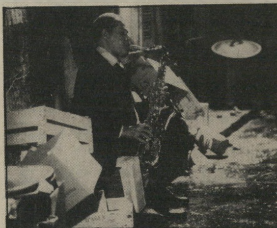
דקסטר גורדון — נשמה כושית בין גרוטאות פאריס

מראנסיס, בטרט: מראנסיס בורייה — הוא אותו מעריץ נאמן של הסקסופוניסט דייל טרנר, בגילומו של דקסטר גורדון, שהוא