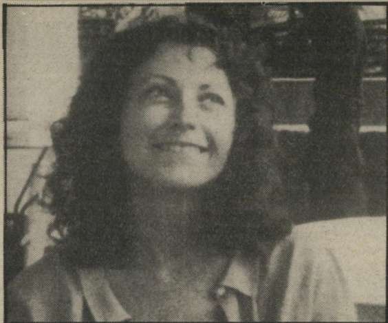
מארי ריווייר — פיתרון ברגע האחרון.

שלא כבסרטיו הקודמים, נוקט רוהמר הפעם בסיגנון כמעט תיעודי בהצגת הנושא. הדיאלוגים נכתבו בשיתוף-פעולה עם השחקנים, כדי שירגישו חופשיים ככל האפשר, הצלמת שעבדה עימו התבקשה לעקוב אחרי הדמות הראשית בטכניקה שהיתה