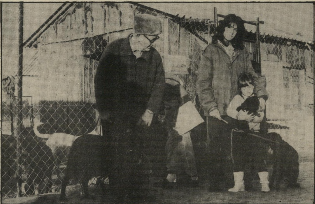
מתנדבי צעיר-בעלי-חיים במוסד "השרון" הכסף לא הספיק להשלמת הגג

אותם משם. היו שם כלבים קטנים וגדולים, גיוועים ואחרים, שהגיעו למקום בנסיבות שונות ומשונות. זאת סיפרו לי מאוחר יותר מנהלות המקום, אדית רוזן ויווה אליעזר. שתיהן יזמו את הקמת המקום, ונמצאות בו רוב שעות היום.