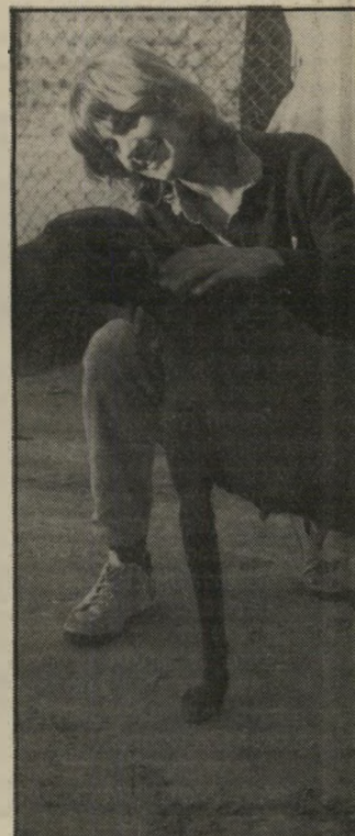
מורה בר והכלבה נדיה מתוך בור עמוק

ל אגודת צעיר-בעלי-חיים השרון הגעתי אחרי חיפושים ארוכים ומייגעים. היה זה אחרי שמישהו השאיר ליד רלת ביתי קופסה ובה ארבעה גורי-כלבים, בני שלושה שבועות. חששתי להביאם לצעיר בעלי-חיים ברחוב סלמה ביפו, כי ידוע לי מנסיונות קודמים, שלי ושל אחרים, שהמדיניות שם הינה צימצום מיספר החיות. במילים אחרות: השמדה. וזאת בגלל הצפיפות האיומה הקיימת בי מקום.