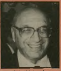
יעקב נמרודי בשעת-לילה מאוחרת.

● השם יעקב נמרודי מפורסם בכל רחבי תבל, בפרט מאז פרשת איראן-גיט. בכל זאת, מסתבר כי נמרודי — יהודי גדול-מימדים — עדיין מתרגש כאשר נכתב עליו בעיתונות. ביום החמישי בלילה היה נמרודי סקרן במיוחד לדעת כיצד נראה הראיון שהעניק לידועות-אחרונות. ושעמד להתפרסם בגליון של מחרת-היום. הוא ביקש מעיתונאית שתיתן לו טרמפ לאירוע שהתקיים במלון הילטון, לא התאפק והפציר בה שתיתן אותו בדרך למערכת ידיעות אחרונות, שם יקח עותק מהעיתון שלמחרת. העיתונאית לא התלהבה מהרעיון. אולם כוח-השיכנוע של נמרודי כבר הפך לשם-דבר. וכך, בשעת-לילה מאוחרת, נאו המיליונר המפורסם והעיתונאית נכנסים דרך השער האחורי של הבניין בשקט-בשקט. אלא מה! השניים זוהו מייד על-ידי השומרים, שאצורצו להביא להם את מבוקשם, והכניסה המחתרית הפכה לחגיגה שלמה. אל נמרודי עוד הופנו בקשות של גמילות-חסדים, בטרם מיהרו השניים אל מכוניתה של העיתונאית. ליד הילטון עצרו השניים, והעוברים-השבים יכלו להבחין בנימרודי קורא בקול רם מילה-במילה את הראיון עימו. באוזני הצעירה שלצידו, תוך כדי הסברים ופרשנויות שהשתיקה יפה להם.