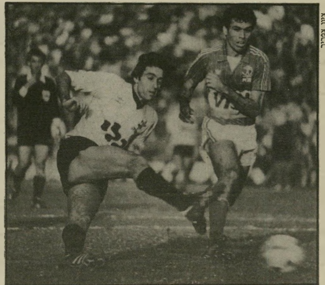
כדורגלן מכנס בפעולה מעניין לעלות!

שאלתי אותו אם הוא מעדיף להיות ראש לשועלים במקום זנב לאריות.