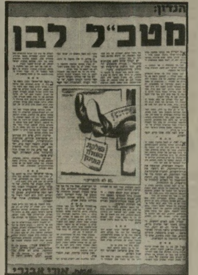
מטכ"ל לבן: 24.10.56. הד קלוש או קריקטורה

פירסמתי במאמר זה רעיון שכבר העליתי אותו שלוש שנים לפני-כן. עיקרו: שיש צורך בהקמת מישרד ממשלתי מיוחד, בראשותו של שר בכיר,