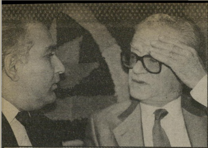
שגרירים ישוון ובסיוני בקשה רשמית