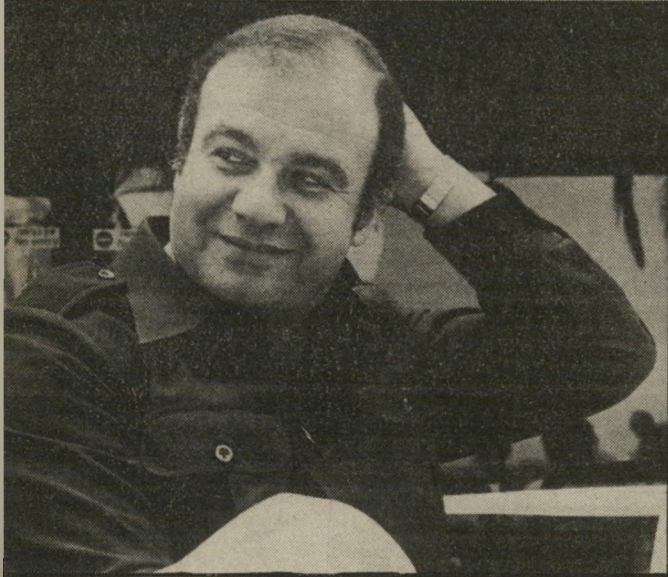
סגן ראש-שולחן עיסה חולה ומארח