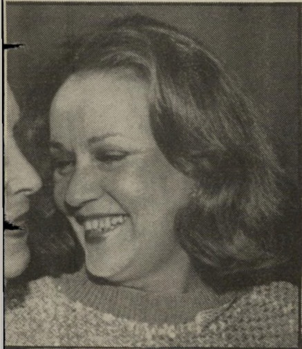
שחקנית מורו טור-דה-פורס

עוד סיבה לכך שכדאי לראותו בסמוך לראן היא פשוט כדי לראות מאין צמחו רגליו של המלך ליר שלו. אילו מקבת היה מצליח במזימתו לרמות את הגורל, היה הופך למלך ליר. כשם שלידי מקבת היא המשכה הרעיוני של מדאם קאדה, ושתי הנשים בתאוותם הבלתי-מרוסנת לכוח ובאורחות התנהגותן הצמקונית אינן אלא אחת. לראיה - שתי השחקניות, נפלאות ויפהפיות שתיהן. איסוזו יאמאדה כאסאיי, בסרט הזה, ומייקו האראדה כמדאם קאדה, אשת הבן בראן, מעוצבות ומאופרות כמסיכות נן, הסיגנון התיאטרלי המסורתי היפאני. שבא להתריס כנגד הצופה חד-משמעית - שתי הדמויות האלה, בשני הסרטים, אינן אלא דמויות סימליות טהורות. אבל, בה