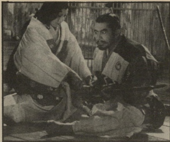
טושירו ואיסוזו - רוצחים ולא יורשים