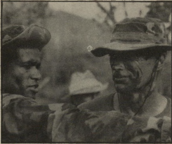
איסטווד עם מריו ואן פבלס - בכובד-יד

אם איסטווד, אחד השחקנים-בימאים המעניינים ביותר היום בארצות-הברית, בחר לו עליה מעין זו, נראה שרוקי וראמבו אינם בדיוק העוגיות החביבות עליו. הוא איננו שותף לשיטפון ההערצה העצמית של גל הקולנוע הרגניסטי, השוטף בסערה את הקולנוע האמריקאי, ועוד יותר מזה: יש מסר אישי מאוד, שאיסטווד רוצה להעביר אל הצופה - מתחת לדיא-לוגים הרצופים במילות-זימה, בבדיחות גסות ובמילון הצבאי המשוכלל ביותר שנשמע אי-פעם אל הבד, וזהו המסר: אין עוד מקום לפאטונים, הגיבורים האינוודאליסטים גמרו את שרותם, הצבא האמריקאי, כמו האומה כולה שקע בניוניות אימפוטנטית, וגם העבודה שמנסים לספק לאותם גיבורים