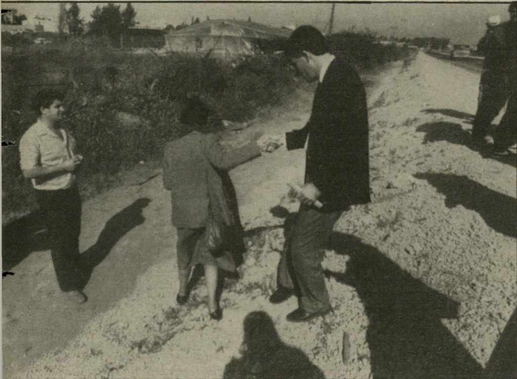
יד מושמטת לשופטת הסניגור, שימעון שובר, מושיט יד לשופטת שולמית ולנשטיין, שירדה אל תוך התעלה שליד הכביש הראשי מחיפה לתל-אביב. למטה, עומד הקצין דויד שדה, מצוות החקירה. הכביש קרוב למקום בו שכבה הגופה.