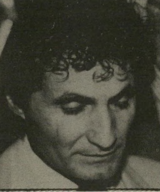
מפוטרי פאר, שיטות מפא"י

מוכר במיפלגת-העבודה, בשם חוג ה"צעירים, שפאר הוא ה"יר" שלו. אבל אמביציות פוליטיות לחוד ופרנסה לחוד. פאר לא עירבב בין התחומים, וסבר לתומו כי גם איש מיפלגת-העבודה יכול לעבוד במישרה זוטרה במישרד-התיירות של השר הליברלי שריר.