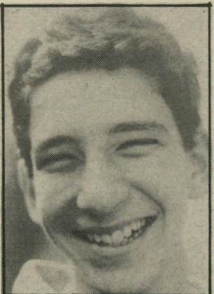
ניר בנגן, ביתה י', עירוני ה': נגר, נגר. נגר! לחבוש כיפה זו זכות ולא חובה. מי שרוצה לחבוש כיפה — בכפייה. אני לא אניח על ראשי כיפה בשביל העיקרון, ואלחם נגר כל כפייה דתית.