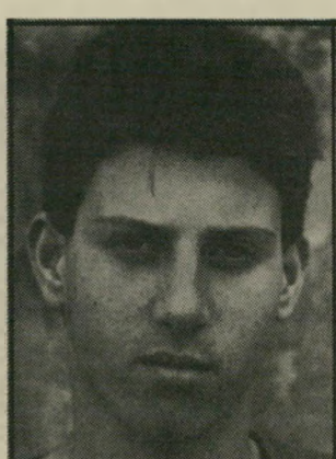
שגב ארלסבורג, ביתה י"ב אנקורי: חאלס: זה סתם ביובו זמן להתוכח על העניין הזה. זה חוק טיפשי וכלי שיניים. כל אחד צריך להתנהג לפי הבנתו. שינסו לחייב אותנו, נראה אם יצליחו!