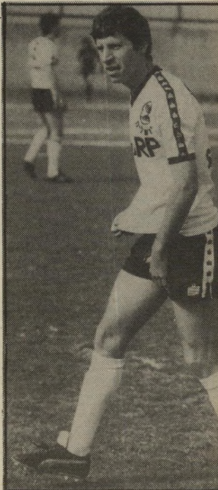
מאמן נוימן על פי יישק דבר: "על פי יישק דבר"

אני המאמן, ועל פי יישק דבר. כמו כן שאני חייב לציין שלבית"ר תל-