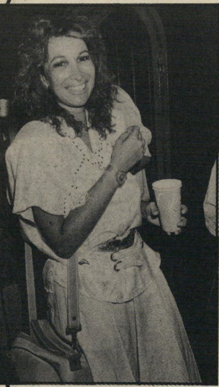
שרי צוריאל - בשם אפי

יש בארץ שתי זמרות שבעיניי הן דומות. שתיהן יפות, שתיהן זמרות טובות, שתיהן גרושות כבר שנים, שתיהן מחוזרות מאוד ושתיהן שומרות בסדר גדול את הרומאנים שלהן מפני העיתונות, ולא מוכנות להגיד מילה. דווקא בגלל זה החלטתי לעשות מחקר קטן, ולנסות למצוא מי הוא הגבר בחיי כל אחת משתי הזמרות האלה.