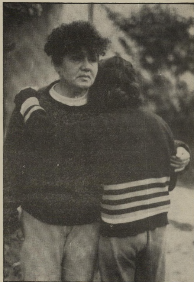
מיכל עם סבתה אידה. גידלתי אותה באהבה ובמסירותו!

ש ני שוטרים ניסו להוציא את מיכל (שם בדוי) מהבית. מיכל התנגדה. היא בכתה וצרחתה. נאחזה בכל הכוח באופניה ולא הסכימה לצאת. השוטרים הזעיקו בקשר עוד שלושה מחבריהם, וכשאלה הגיעו, הם סחבו את מיכל ברגליים כמו שק תפוחי אדמה. היא היתה היסטרית. אבל הצעקות והבכי לא עזרו לה מול חמשת השוטרים. כל אותה העת עמדו העובדות הסוציאליות בצד ולא פצו פה.