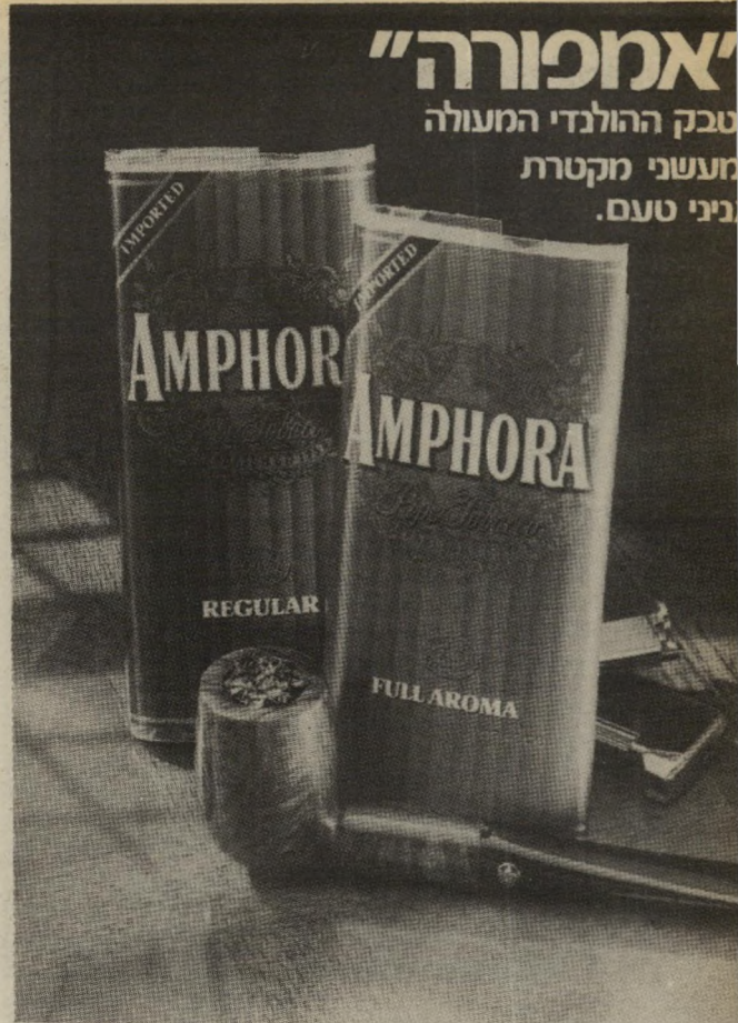
אזהרה: משרד הבריאות קובע כי — העישון מוזק לכריאות

עתה מסתבר כי הכסף שנל"קח מן הציבור ששוט נוסף על השחיתות הקודמת, המגיעה כ"יום לממדים גרועים עוד יותר. הציבור ראה איך מומן מסע-הבחירות של הליכוד, על פיזמוניו ומיכ-