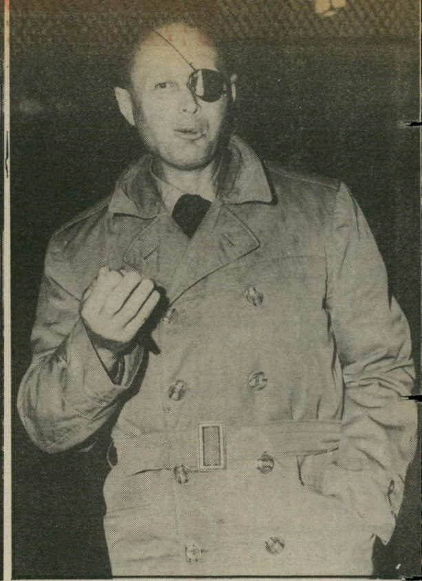
מושה דיין הערבים לא ישלימו

יתכן שהגיע הזמן להרהר באפשרות השנייה: לתת יד לערבים נגד אויביהם, כחלק ממיבצע היסטורי לברית שלום עימם.