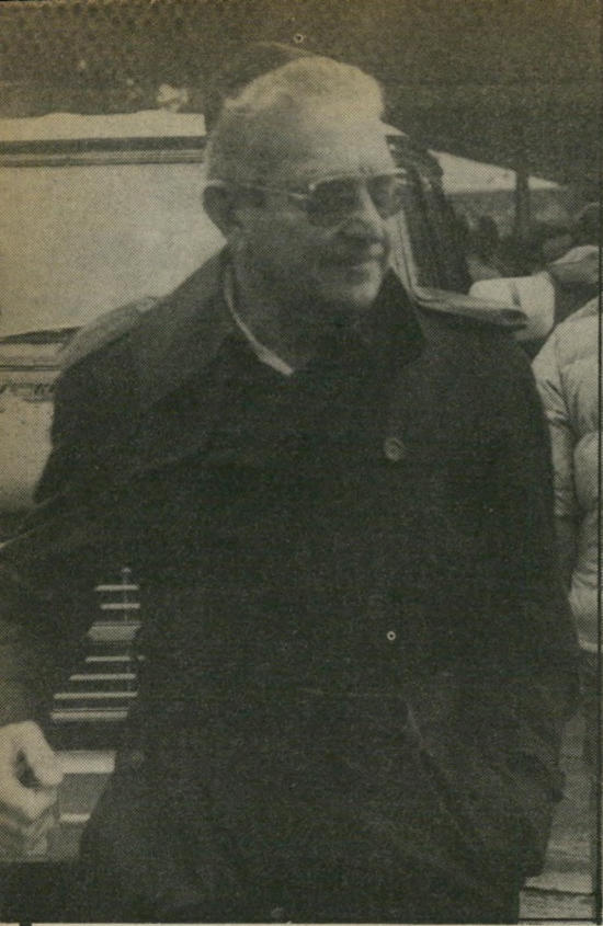
עזר וייצמן הערבים השתנו