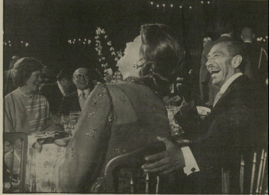
הנשיא סאדאת (עם אשתו ג'יהאן, בגין ורוזלין קארטר) חזרה אל פרעה?

כאשר פיטפט בהיסחיה-דעת על אספקת נשק יש-רלי לאתיופיה).