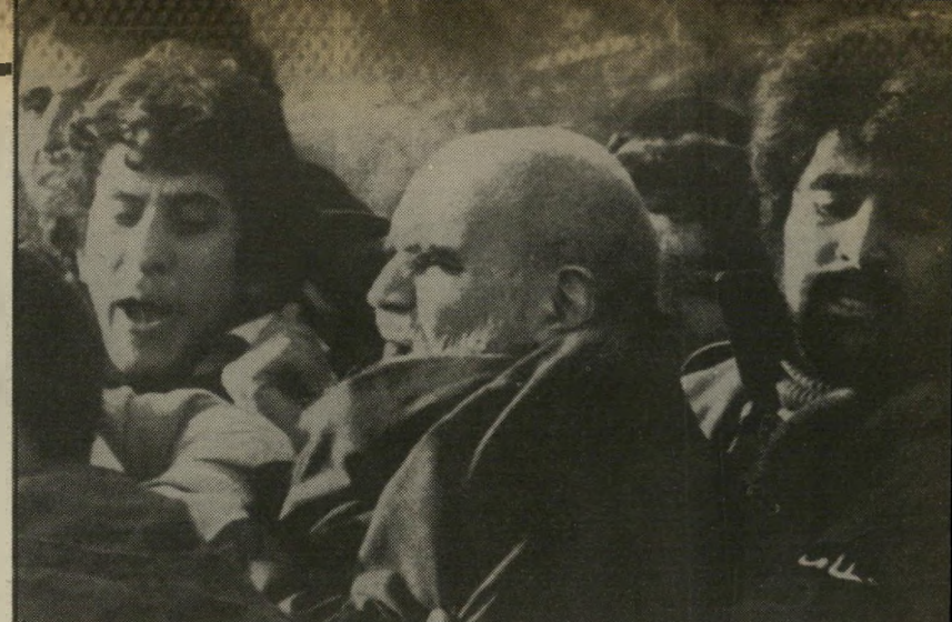
האיית-אללה חומייני (במרכז) חזרה אל השאה?

תפיסה הזאת — שהעולם הערבי הוא אויב טיבעי ובלתי-נמנע, שיש ניגוד קיומי