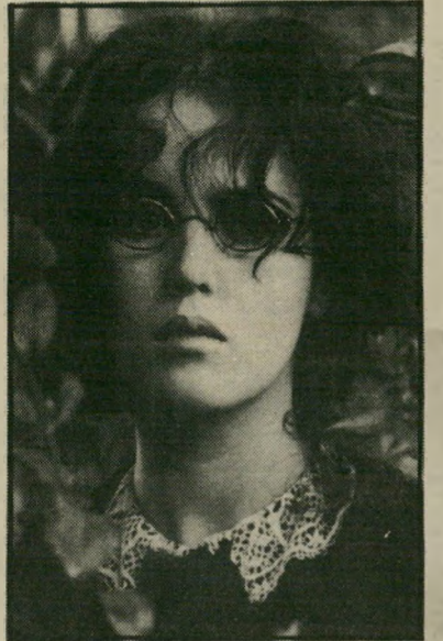
שחקנית איזאבל ארג'ני לחלק את העונה

חברי המועצה ימנו הודרש, ודרך פעולתה מתחלקת לשניים: היא יושבת כשתי ועדות