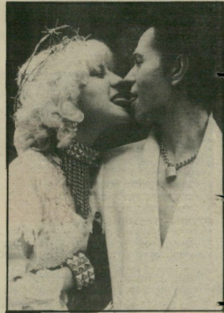
קלואה ווב וגרי אולדמן ב"סיד וננסי" הטובה לשנת 86

תמיכה נפרדות. האחת לסרטים של בימאים חדשים (סרט ראשון או שני), והשנייה לבימאים מוכרים ומנוסים.