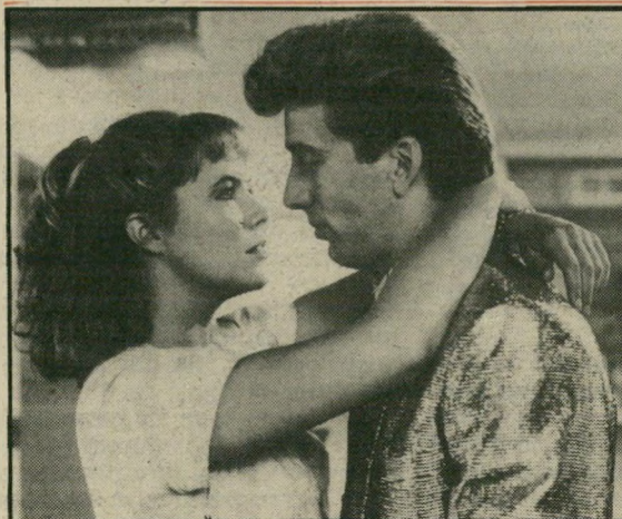
קתלין טרנר וניקולאס קייג: קופולה רדוד

על איזה חלקים מעברה היתה חוזרת, ומה היתה מתקנת? זו אולי השאלה המוסרית-פילוסופית המעניינת ביותר שאפ"ר לשאלו בסרטים המעמידים במבחן את אחת העובדות הבסיסיות והאכזריות בחיים - הזמן, עשה זאת ספילברג,