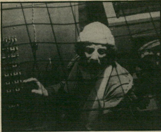
הלגה יורדל: מפחד מהדב הרוסי

מרכז הסרט, שהוא גם החלק הבשרי והמרתק ביותר שלו, מוקדש כולו למירדף של הרוסים אחרי הספינה הנורווגית, כשאת הנקודה האנושית מספק כלבלב שחור, ידידו של אחד