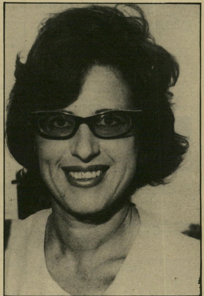
כתבת-רפואית נמיר אינטריגות במקום הבעת דיעה

כתב רפואי בעיתון ובכלי-התיקשו" רת האלקטרוניים תלוי במאת האחוזים במחזיקי המידע. כלומר — רשילטון הרפואי. כדי לראיין מנהל-מחלקות או מנה" לייכתיחולים, על הכתב הרפואי לקבל אישור של רובר מישרד-הבריאות או רובר מרכז קופת-חולים, וניתן להשיג