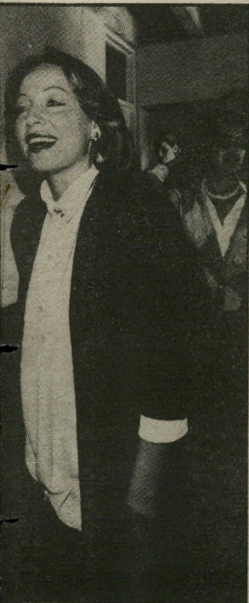
התנו המנצחת והיריבה בית-המישפט קיבל כל מה שטענה