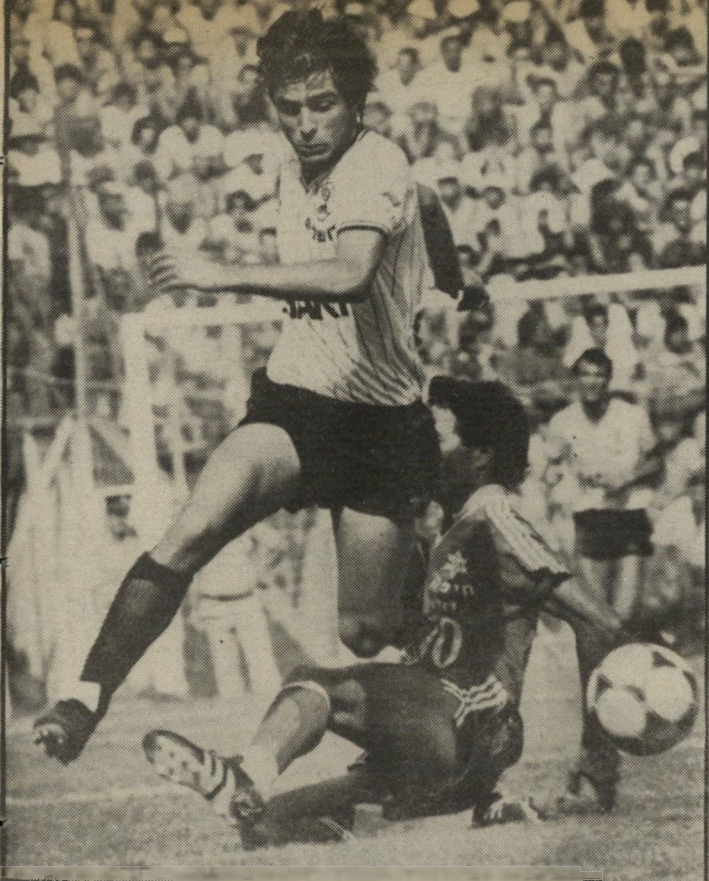
כדורגלן אוהנה למה הם תמיד נכנסים ללחץ?