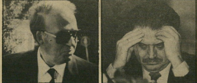
יועץ חריש, במיקרה הנדון עבר כל גבול סביר... שר שריר

הבינלאומיים של מדינת ישראל עם מדינה זרה. מכאן גם נובעת הסמכות המיוחדת והרחבה שדיני-ההסגרה מייחדים לשר-המישפטים, שהוא נושא משרה פוליטית. והיא נוגעת למישור היחסים הבינלאומיים של המדינה — להבדיל מן הסמכות המסורה לבית-המישפט בהליכי-ההסגרה. שמטרתה בעיקר להבטיח זכויותיו של המבוקש. התערבות הבג"ץ ביחסי-החוץ של מדינת-ישראל ובקשת הסגרה שבשלב זה היא מעניינה הבלעדי של מדינה זרה (וזו תהא המשמעות המעשית והאמיתית של התערבות הבג"ץ בהחלטתו של שר-המישפטים). וכל זאת, לפי פניית העותרים שאין להם שום זיקה לעניין — התערבות כה מרחיקת לכת כמוה כפריצת כל הסכרים והגבולות. הן מבחינת התחו"מים הראויים והמתאימים לשפיטתו של הבג"ץ והן מבחינת סוג האנשים שראוי להכיר בהם כבעלי מעמד לעניין עתירה לבג"ץ. עם כל ההרחבה שחלה בשנים האחרונות בהתערבותו של הבג"ץ, הן מבחינת העניינים שבהם התערב והן מבחינת סוג העותרים שבמעמדם הראוי הכיר, הרי עד היום לא הרחיקו הדברים לכת עד כדי כך. וגם משהכיר בית-המישפט העליון במעמדם של עותרים שאין להם