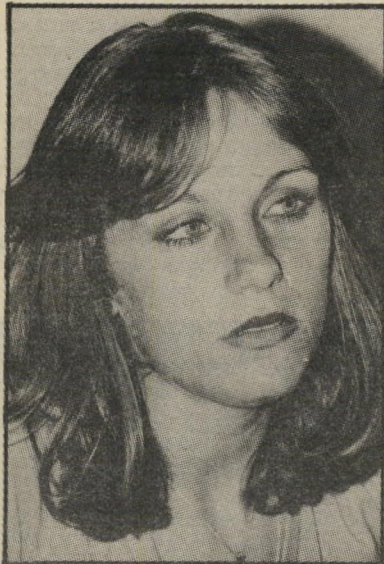
אורנה גאון הוא תמיד מוכן לעזור לי!

דריג-דריג. את אורנה גאון , בבקשה! "מרבית!"