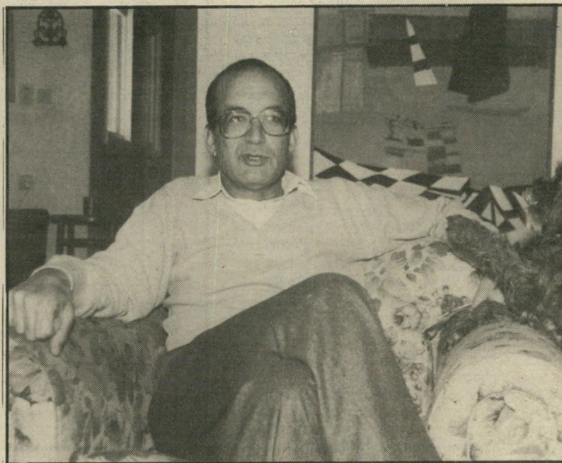
שריד השבוע בביתו. אני לא מתפש סיבה כדי להיות אחוז-חרדה!