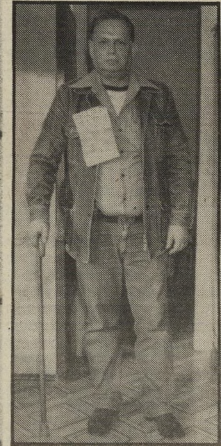
נכה זלקו פגז בכיכר הדווידקה

לארץ. הכאבים לא פגו. להדפך. התיחוקו. הרופאים הישראלים איתרו את מקור הבעיה: פרק הירך. רסיס עתיק של הפגז הוא שחק את החסוס וגרם לכאבי-תופת. הפיתרון — ניתוח להשתלת חסוס מלאכותי.