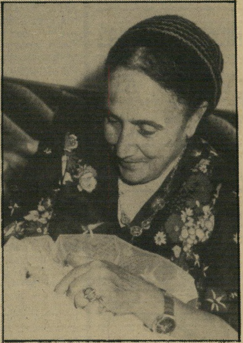
מרסאה בצמחים פריחה שויין המימסד החליט -

מסיכומים אלה משתמע שהפעלתן של המחלקות והיחידות לטיפול נמרץ יקרה מאוד, אך הן לא הקטינו במשך 25 שנות קיומן את התמותה הכללית אלא ב-10.001%.