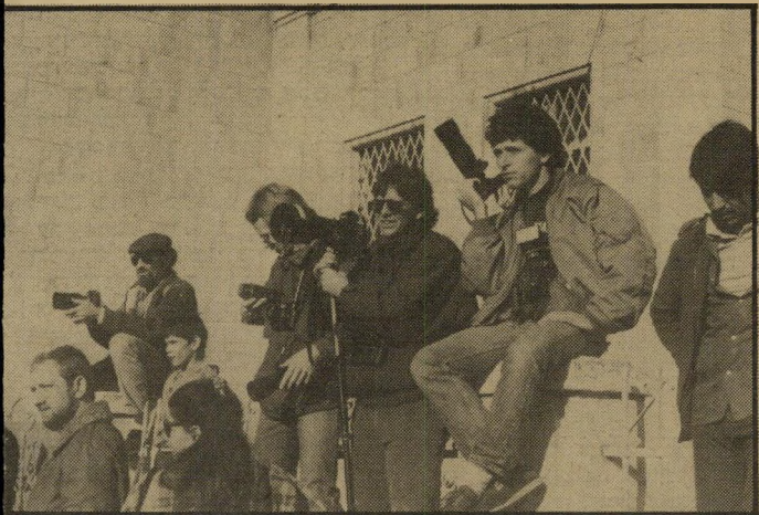
הצלמים הזרים והמקומיים. שמאחוריהם הרבה שעות של ציפיה לוועוננו. המתנינו השבוע לצאתו מבית-המישפט במשך שעה וחצי, ולבסוף לא ראו דבר.

ל מילחמה בין ועוננו והתיקשור רת לבין המיסד נוספו השבוע ארבעה כלי-נשק חרישים: וילון לבן, שק בהיר, מיטריה אדומה וסולמות מתכת קטנטנים. הצלמים, המסקרים את תולדות מעי צרו של ועוננו, הביאו עימם סולמות קטנים. כמו הצלייניות היווניות הדי