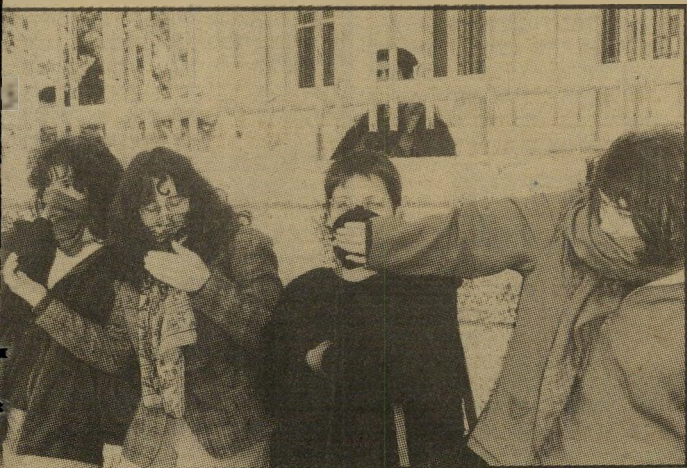
האנארכיסטים ארבע צעירות מהחוג האנארכיסטי באוניברסיטה העברית סתמו את פיותיהן בצעיפים, רמז לסתימת-פיות. הן היו האירוע היחיד בשעת הציפיה.

קנות, הסחובות איתן כיסאות ועזרים, משכו אחריהם הצלמים את הסולמות. רוצים — מעמידים את הסולם, מטפסים לראשו, מחפשים זווית-צילום הוגנת. רוצים — מעמידים את הסולם על הכתפיים, אישם בין המצלמות, ורצים מייד הלאה.